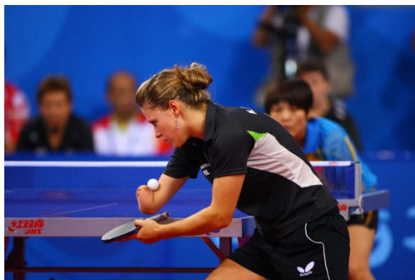
Natalia Partyka, http://www.nataliartyka.pl , Juegos Olímpicos de Beijing 2008

Pero, por supuesto, no es esperable que todos los niños focomélicos de este mundo tengan la fortaleza y oportunidades de Alison Lapper y Natalia Partyka: