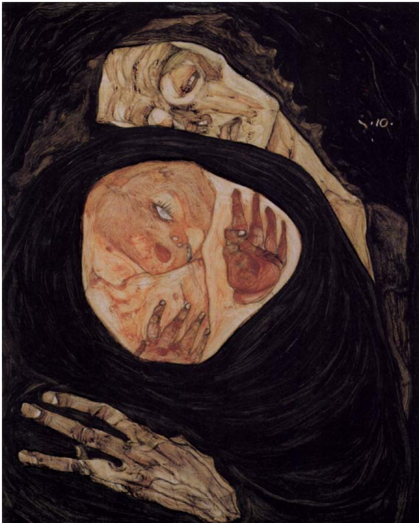
Egon SCHIELE (1890-1918). "Tote Mutter I" (1910). Óleo sobre tabla.

Romeo and Juliet, Acto I, escena 5ª, 137-40.